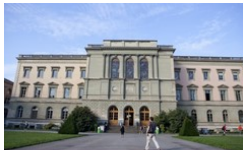
SITE UNI BASTIONS