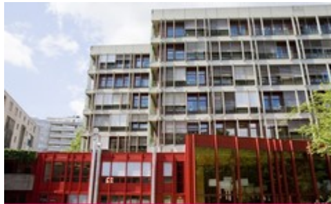
SITE UNI CMU