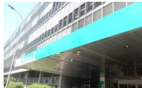
SITE UNI ARVE