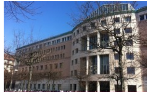
SITE UNI MAIL